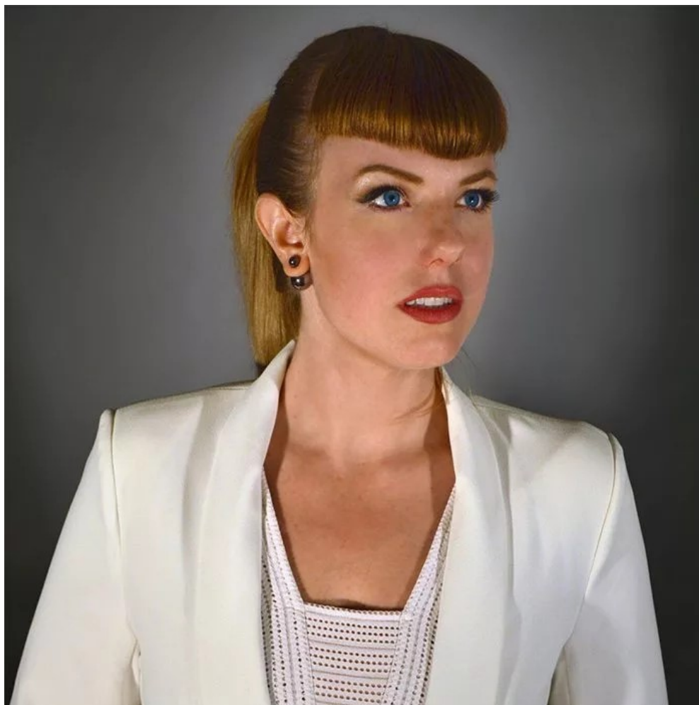
O retrato de Amy Karle.

O progresso tecnológico é frequentemente entendido como o polo oposto à natureza e a organicidade, entretanto alguns artistas buscam criar pontes entre a tecnologia e a experiência humana. Se destaca entre estes, a artista americana Amy Karle.